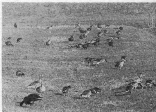
Van deze 51 kolganzen zijn er 17 ernstig besmeurd. Tonnekreek, 16 Januari 1971

Op 29 december zei Ir. van Melick van de PNEM dat binnen enkele dagen de Amer schoon zou zijn. Vooral Rijkswaterstaat heeft vaak de hele kwestie afgezwakt. Terwijl tijdens het oplepelen regelmatig verkliederde vogellijkjes in de transportschuiten ploften spraken functionarissen van Rijkswaterstaat nog smalend over één dode reiger. Het dagelijks bestuur van de Gemeente Made c.a. deelde de eerste dagen van de ramp het optimisme niet doch draaide later bij om uiteindelijk