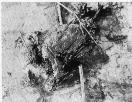
Deze „oliebol" was een eend

De vier kolossale tanks staan aan het randje van de rivier, dicht tegen elkaar. Aan de rivierzijde ontstond in een tank een scheur over de volle hoogte van de stalen wand, waarvan de dikte van onder naar boven verloopt van 22 mm tot 6 mm. Over totaal 2/3 van de omtrek scheurde de wand in de kim los van bodem en dak, draaide door de druk van de olie als een gigantische deur open en zakte later als nat karton in elkaar.