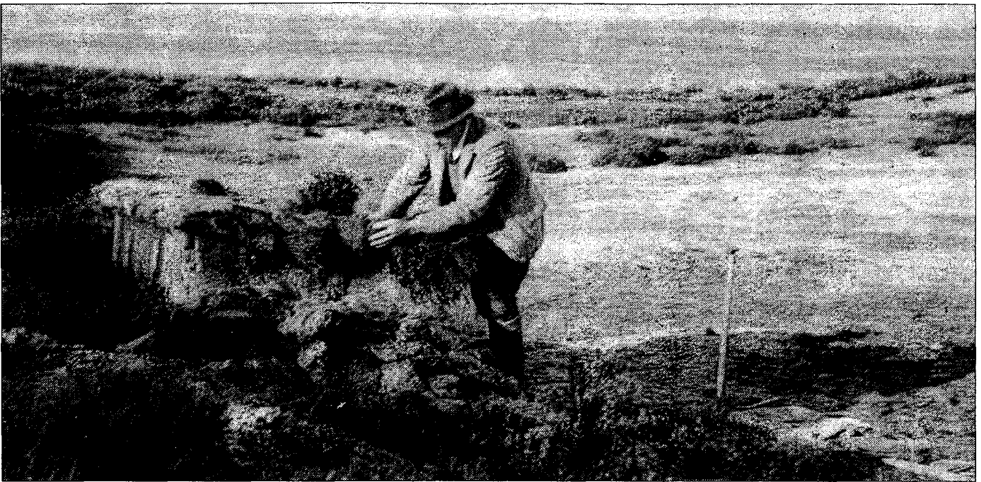
Schuilhut voor het fotograferen.