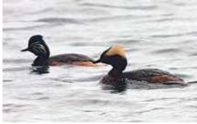
Figuur 4. Kuifduiker met Geoorde Fuut in Berkheide in juni 1967. Still uit het filmpje van Jan P. Strijbos.