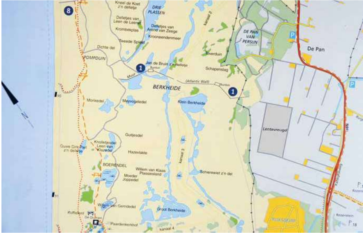
Figuur 3. Kaartje uit Dwars door de Duinen met veldnamen. De Kuifduiker werd het eerst gezien op de plas(sen) bij de Muur (Atlantic Wall), en werd ook gezien op het grote meer van de Drie Plassen (dichter bij Katwijk), in de Guitjesdel (toen een grote plas nu een duinvallei) en in de Knolletjesdel/Leen van Klazedel (idem).

beide vogels al niet meer worden aangetroffen. Strijbos is mooi op tijd geweest voor z'n beelden (Fig. 3). Hij laat het filmpje op 3 november bij hem thuis aan Rampen zien, als voorprogrammaatje voor zijn nieuwe film over de Waddeneilanden. Rampen vond het filmpje 'goed geslaagd'. Het is alleen bijzonder jammer dat Strijbos voor geen enkel beeld van de omgeving heeft gezorgd; je ziet alleen de twee vogels en water. Het filmpje had bij wijze van spreken overal geschoten kunnen zijn.