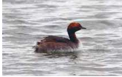
Figuur 5. Kuifduiker op het Grote Meer/Nieuwe Plas in Berkheide in mei 2012. Dichter bij de vogel uit 1967 zijn we nog niet gekomen.

gelijke nieuwe of verdwenen broedvogels. De gebeurtenissen in Berkheide in 1967 worden niet genoemd. Wel drie mengparen Kuifduiker met Geoorde Fuut: in 1985 bij Ossendrecht (1 jong!) en in 1999 en 2016 in het Dwingelerveld (alleen nestbouw). De enige broedpoging van een zuiver paar Kuifduikers was in 2001 aan het Ter Apelkanaal.