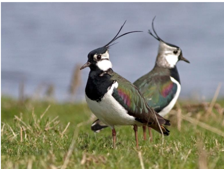
Kievieten